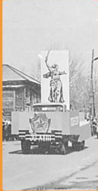
Ул. Коммунистическая. На месте деревянного здания на углу сейчас разбит сквер

Село Поспелиха получило свое название от старожильческого поселения, которое располагалось в пяти километрах от районного центра и носило название – деревня Поспелихинская. Образована она в 1748 году и к началу XX века стала волостным центром Поспелихинской волости Змеиногорского уезда Алтайского края. К тому времени в селе имелся магазин, церковно-приходское училище, пять торговых лавок, ветряные мельни-