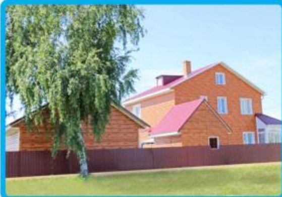
Один из домов в микрорайоне «Солнечный»