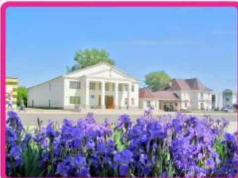
Центральная площадь села

История Поспелихи богата событиями разных эпох. Есть в ней, как и во всей нашей России, страницы печальные, есть и радостные.