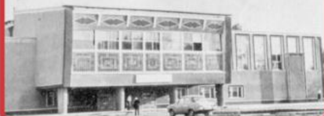
Районный Дом культуры в 1975–2002 годах