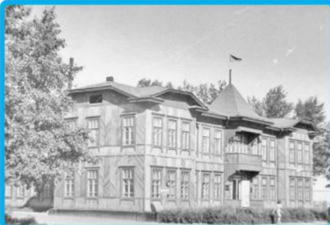
Райисполком, 1977 год